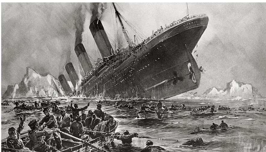
Illustration of the sinking of the ship